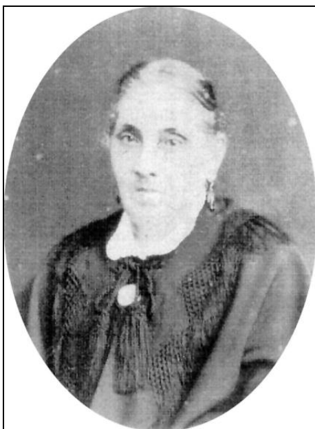
Toribia Arellano (1814 – 1882)

De los restantes hijos, de su tercer matrimonio, breves datos conocemos.