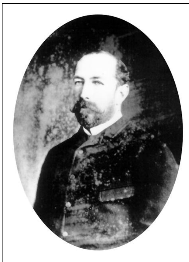
Ramón Biaus (1848 – 1902). Fotografía obtenida hacia 1880.